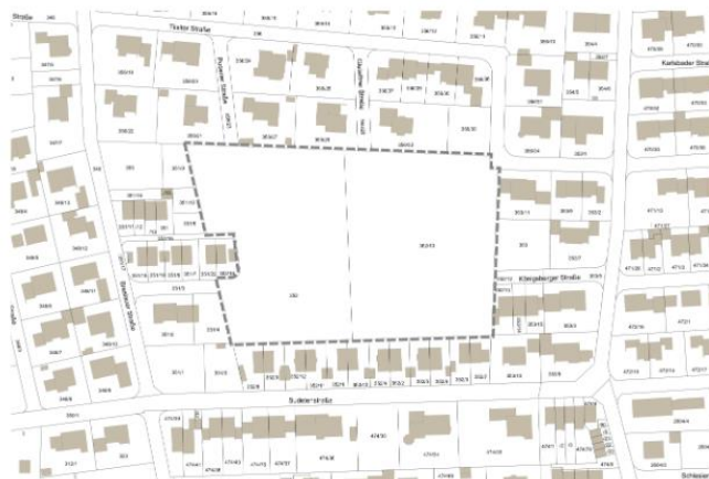
Lageplan mit Abgrenzung Geltungsbereich. Genordet. Ohne Maßstab.